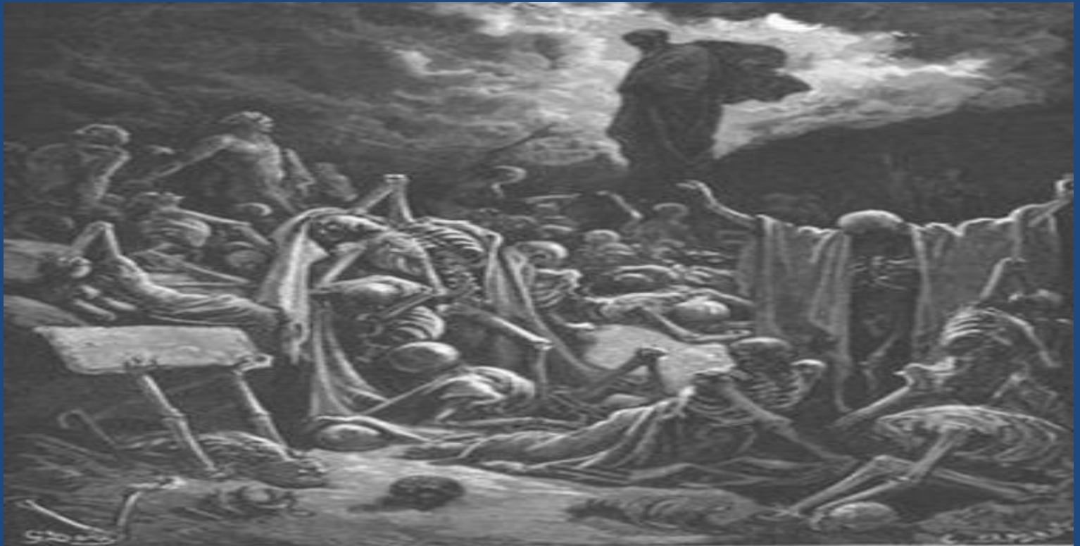
Ezekiel's Vision of the Valley of Dry Bones