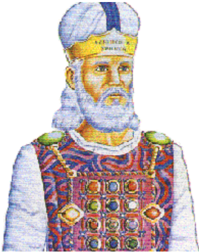
LÁMINA DE ORO: \gamma'י tsiyts

cosas santas, que los hijos de Israel hubieren consagrado en todas sus santas ofrendas; y sobre su frente estará continuamente, para que obtengan gracia delante de YHVH.